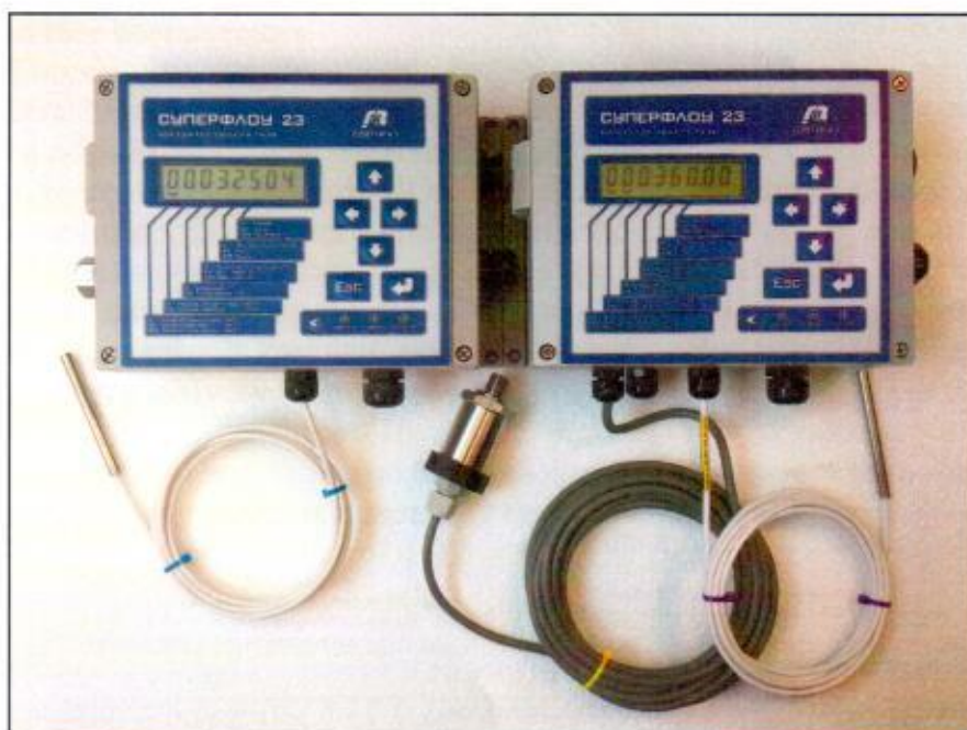
Рисунок 1 - Общий вид корректоров объёма газа «Суперфлоу 23»

Общий вид корректоров представлен на рисунке 1.